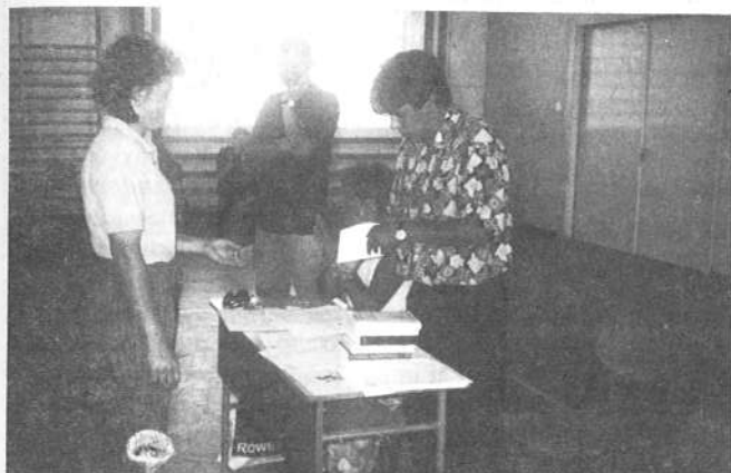
A szellemes vetélkedő győztes csapatának kapitánya átveszi a díjat