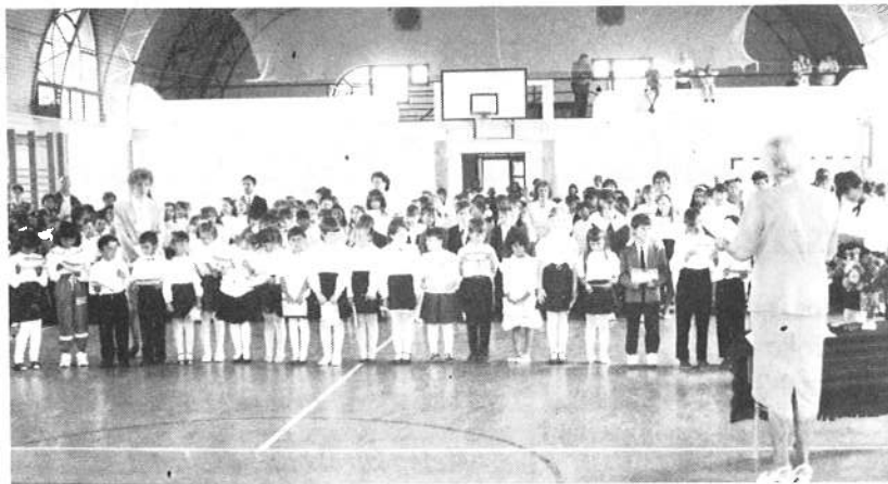
Elöl az elsősök, mögöttük még hét osztály tanulóit a SPORTCSARNOKBAN