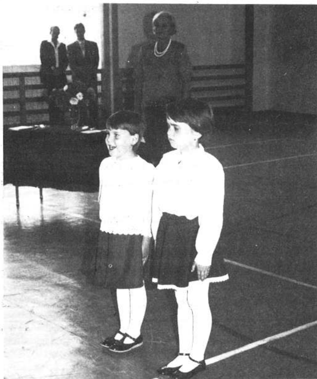
Megszéppent elsősök köszöntői iskolakezdesük alkalmából