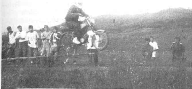
Motorverseny – ugratás közben