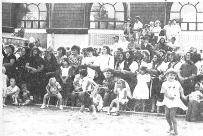
Sokan voltak kíváncsiak a szereplőkre