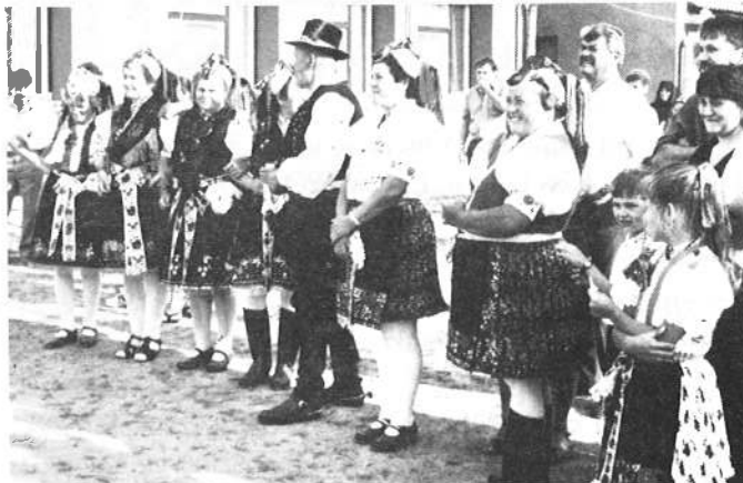
Szereplésre várva nézték a szereplőket