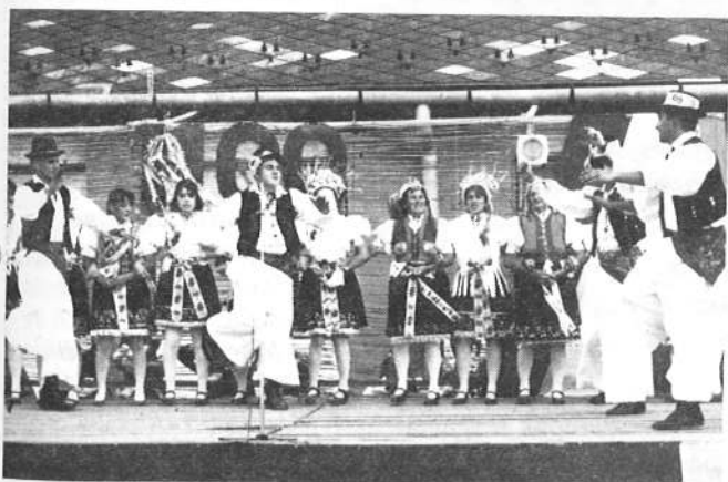
Fiatalos lendület, jó hangulat a folklór műsoron