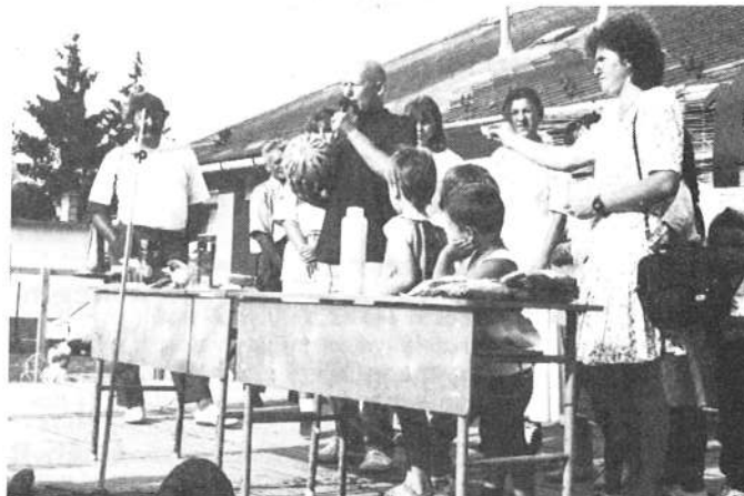
Tombola sorsolás zárta a délután programját