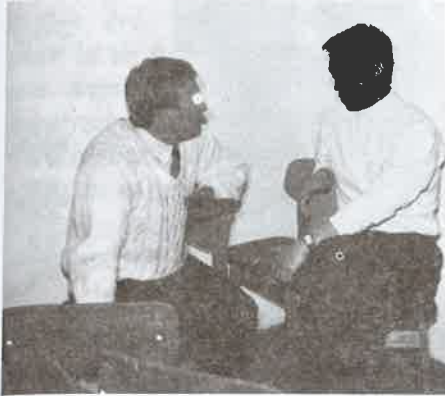
Orbán Viktor és a főszerkesztő interjú közben