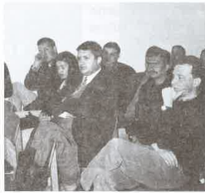
Becsó Zsolt a Megyei Közgyűlés alelnöke a hallgatóság körében