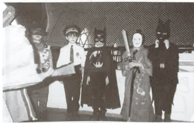
Néhányan a jelmezek közül