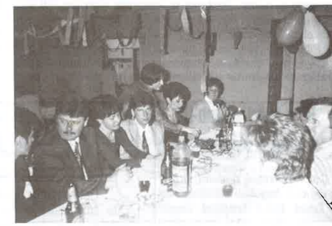
A bál résztvevői