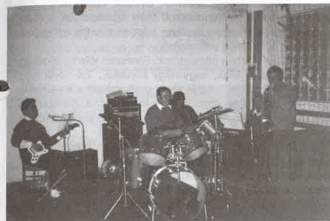
A hangulatos zenét a rimóci zenekar szolgáltatta

A bál, amellyel, hogy nemes célt szolgált, hajnalig tartó, remek szórakozási lehetőséget is adott. A hangulat remek volt, amit képekben szeretnénk bemutatni olvasóinknak.