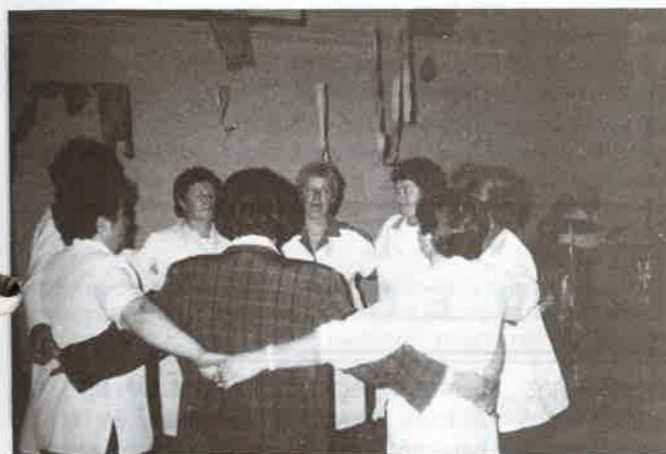
Hölgykoszorúban a konyhások