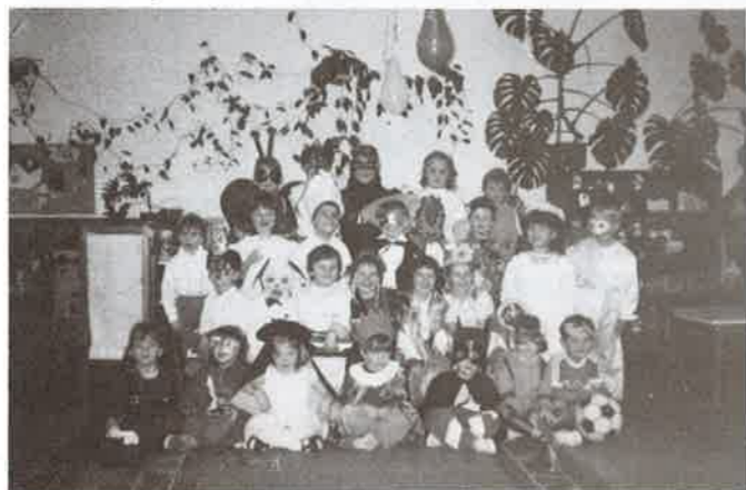
A kiscsoportosok jelmezben