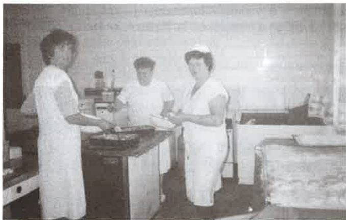
Készül a farsangi fánk az óvodában.