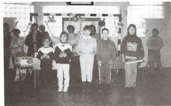
A jelmezbál díjazottai jelmez nélkül