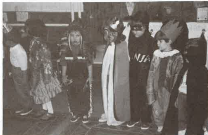
Ötletes jelmezek egy csoportja