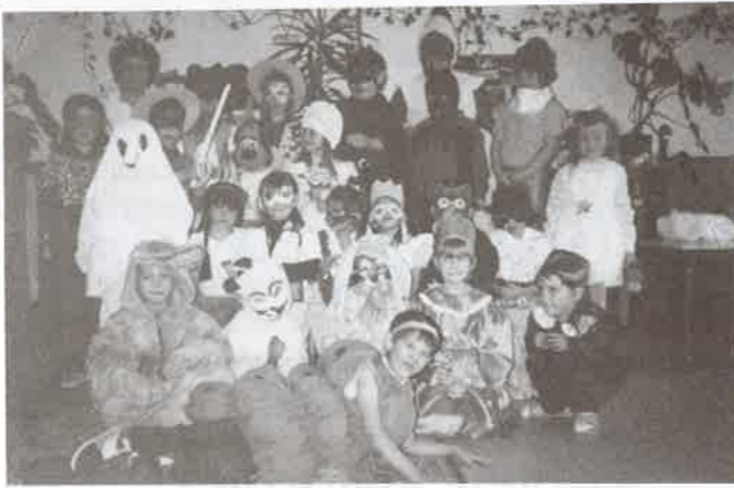
A nagycsoportosok jelmezei is ötletesek voltak