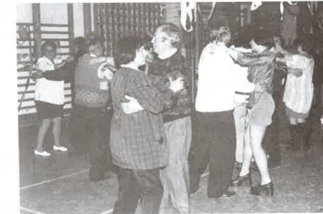
Hajnalban is ropták a táncot