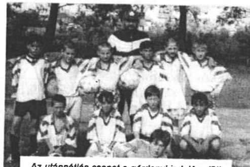
Az utánpótlás csapat a gárdonyi indulás előtt