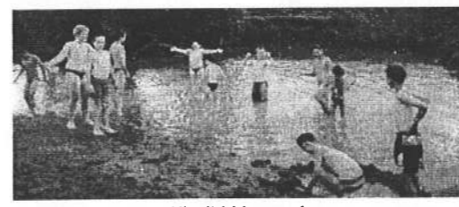
Kicsit hideg a víz