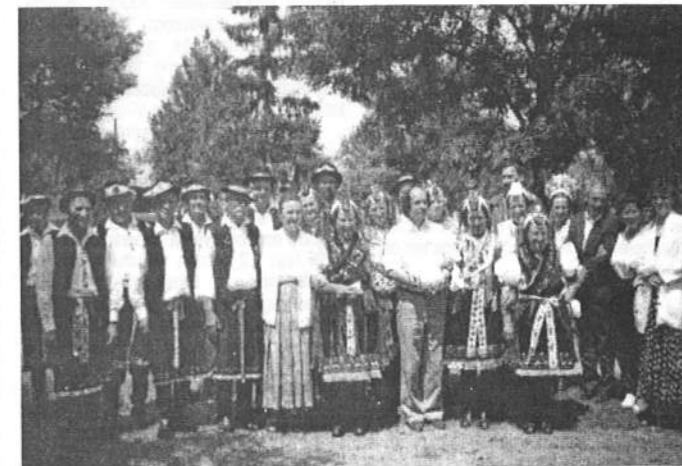
Rimóci csoport a zsűrivel.

Délután Parádon léptek fel, ahol a nézők elismerésüket vastappsal fejezték ki.