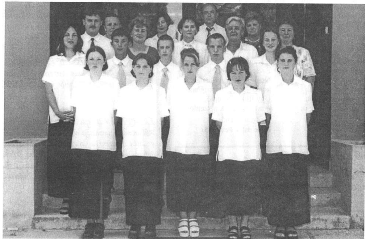
Előző számunkból helyhiány miatt kimaradt ballagóink fényképét most közöljük.