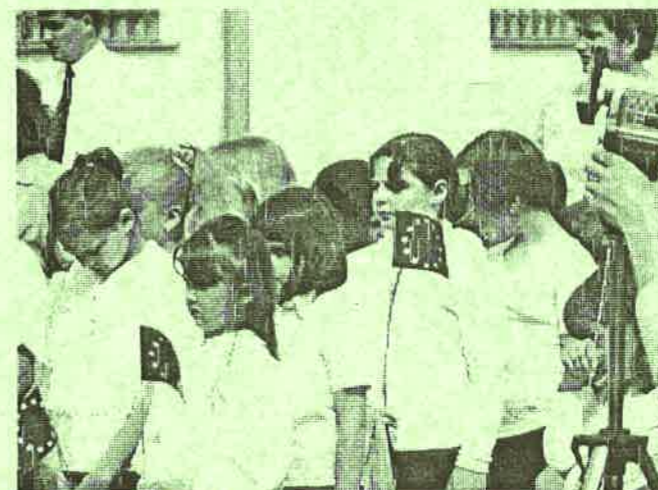
Az UNIÓ előnyeinek élvezői?