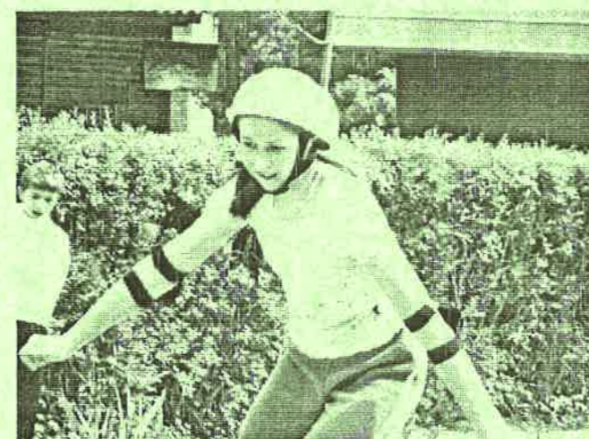
A biztonság mindenek előtt.