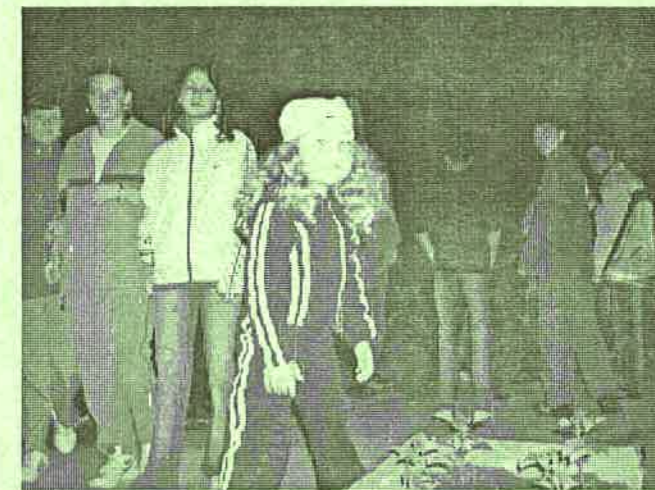
Futás után - tűzijáték előtt.