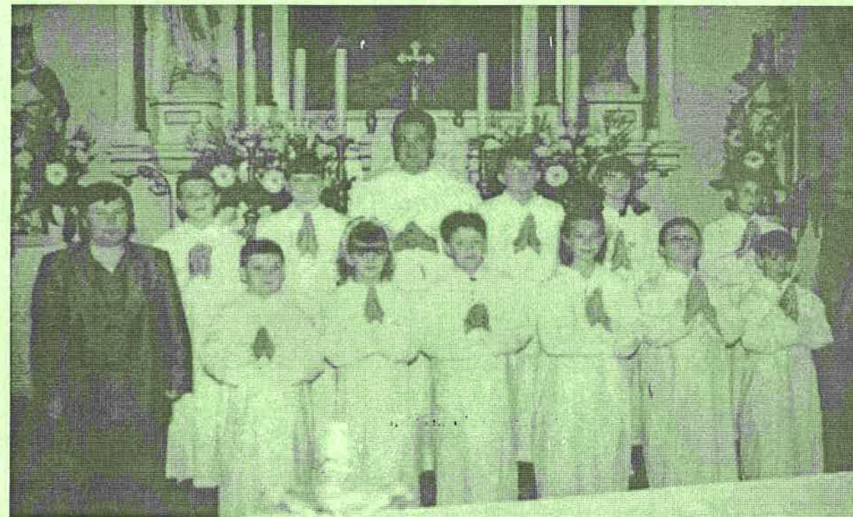
2004. évi elsőáldozói