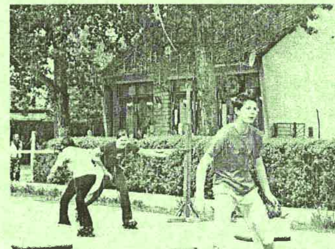
Görkorcsolyás ügyességi váltó.