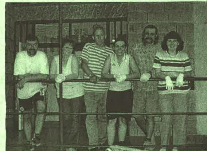
A társaság, miután 2 zsák szemetet szedett össze az utcákon.

Iskolánkban lezajlott a nyolcadikos tanulók középfokú intézményekben történő jelentkezése. 2005. áprilisában mindenki kézhez kapta a felvétélről szóló határozatokat.