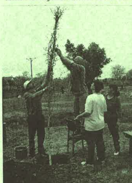
A KOBÁK egy része a faültetés munkálatai közben, míg a többiek a bogrács körül tevékenykedtek.

Az első összejövetelen valóban előkerült a kártya, majd az idők során többször is, de mégis volt valami más, amiért a kezdő tagok szerdánként eljöttek. A felszabadult - néha azért komoly - beszélgetések, a nevetések, a közös játékok összekovácsolták a "csapatot". Így jutottunk el oda, hogy megfogalmazódott közöttünk az igény: szeretnénk létrehozni egy közös egyesületet. Hogy miért?