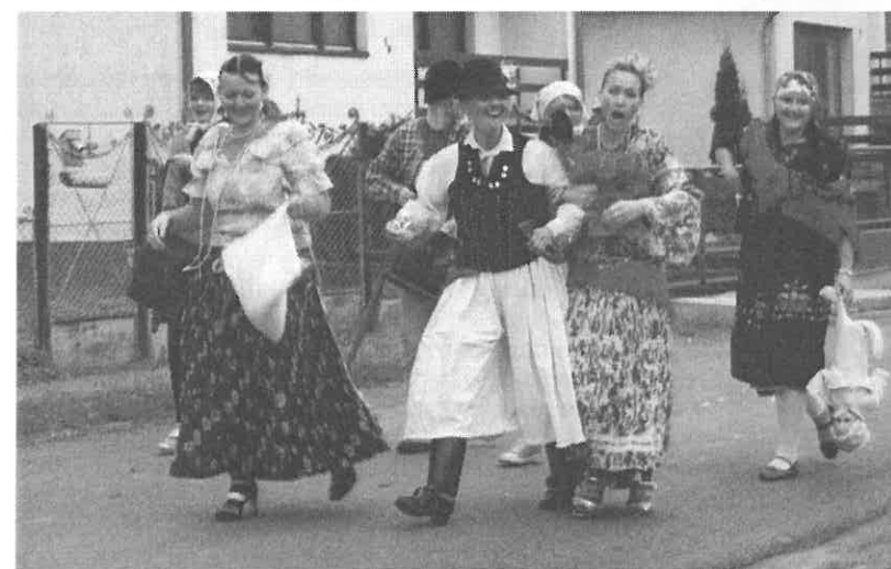
Jó volt látni ezt a vidám csapatot