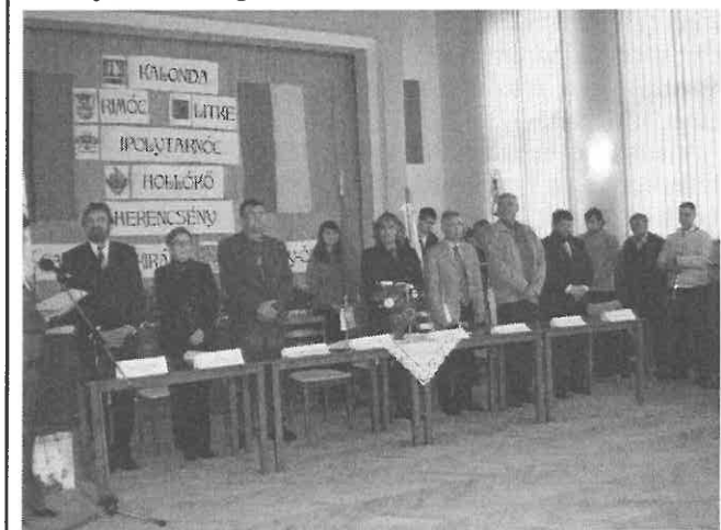
A zászlós bevonulás után