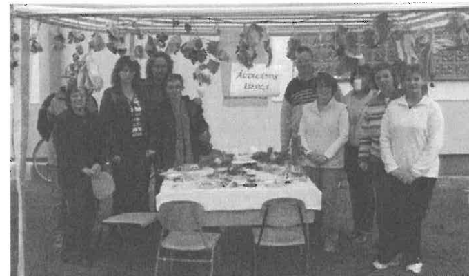
Az általános iskola csapata és a kalondai zsűri