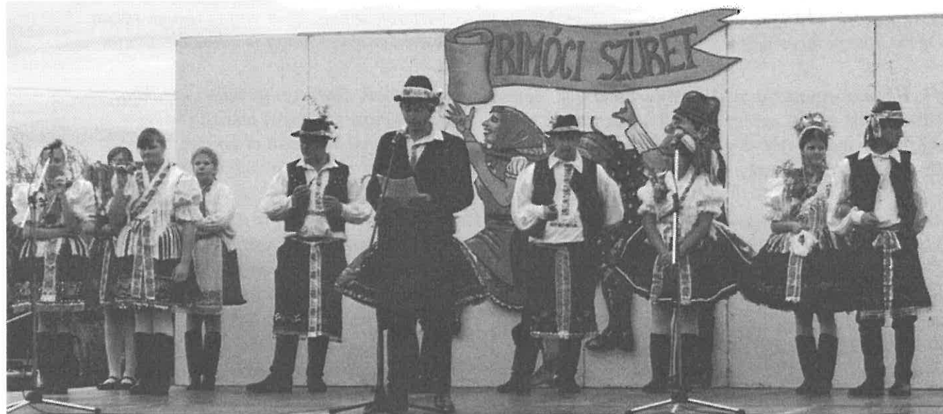
A színpadon az idei szüreti „színe-java”

76. Kedves Rimóciak minden jót kívánok, Az Isten áldása szálljon le reátok. Köszönöm azt, hogy meghallgattatok, Remélem az idén is jól mulattatok.