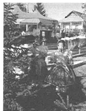
A nyertes kép