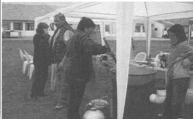
„Rotyog a baboskáposzta”