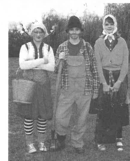
Dicséret a maskarába öltözött fiataloknak