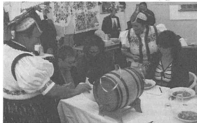
A zsűri ismerkedik a „cakkom-pakk” levessel