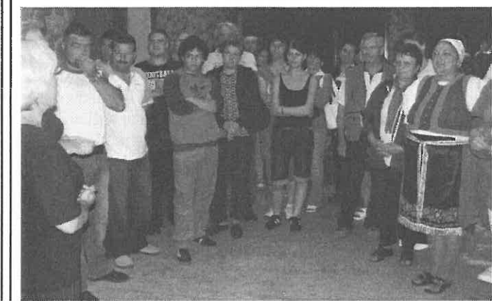
Megérkezés után a köszöntőt hallgatják a rimóci delegáció tagjai