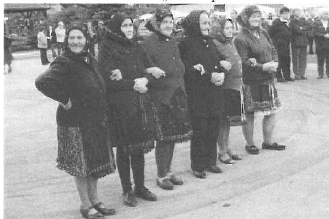
Érdeklődő rimóci asszonyok