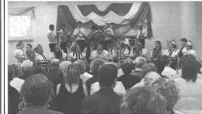
Fellépés az új lengyel kultúrházban