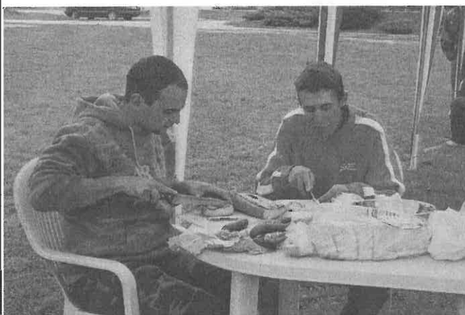
A polgárőrök készítik a katalnba valót