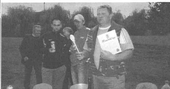
Polgárőrök elnöke az elnyert fakanállal és oklevéllel