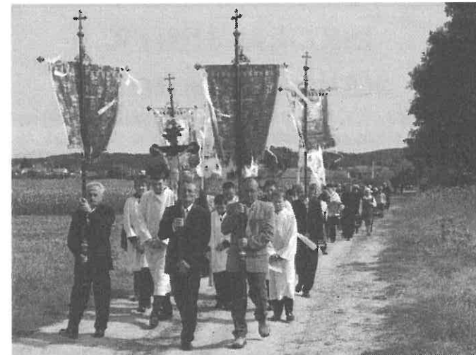
Úton a kápolna felé

Az őseink évszázados fogadalmát megtartva ebben az évben elzarándokoltunk a sipeki úti kápolnához. A menet délelőtt 11 órakor indult a templomból imádkozva, énekelve. Mára már a régebbi hagyományos vonulási rend felborult, senki sem ragaszkodott szigorúan a menetben megszokott helyéhez. A Nemesudvar mellett elhaladva felidéződtek azok az évek, amikor gyerekként ministrálva nem értettem, hogy miért csak itt állt be a zarándoklat elmaradhatatlan résztvevője a Rezesbanda.