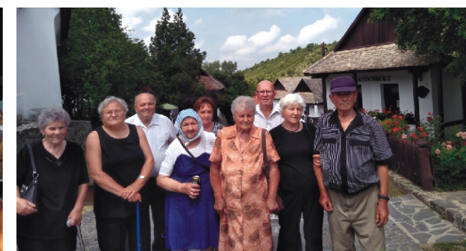
A Szatócsbolt előtt