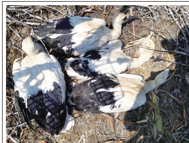
Rimócon 4 golyafióka cseperedik a fészekben, akik június 25-én meggyűrűzésre kerültek