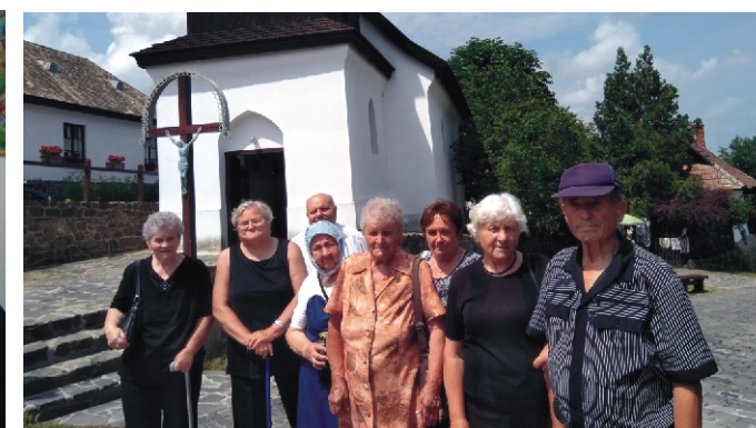
Háttérben a templom