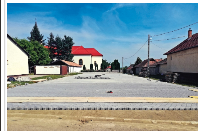
Nemsokára elkészül a parkoló a Szent Erzsébet téren