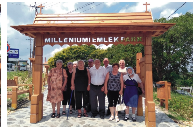
Milleniumi Park bejáratát is Bablena Péter készített