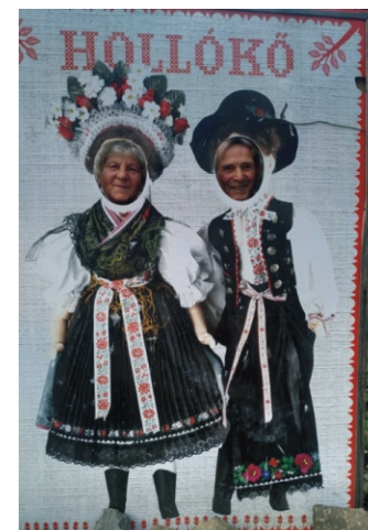
Az Árvai házaspár hollókői népviseletben