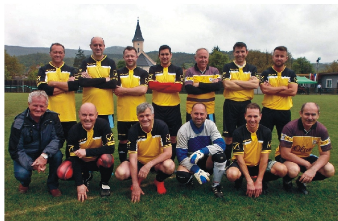
Rimóc Senior csapata Ragyolcon