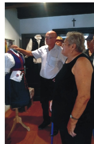
Látogatás a Viselettárban