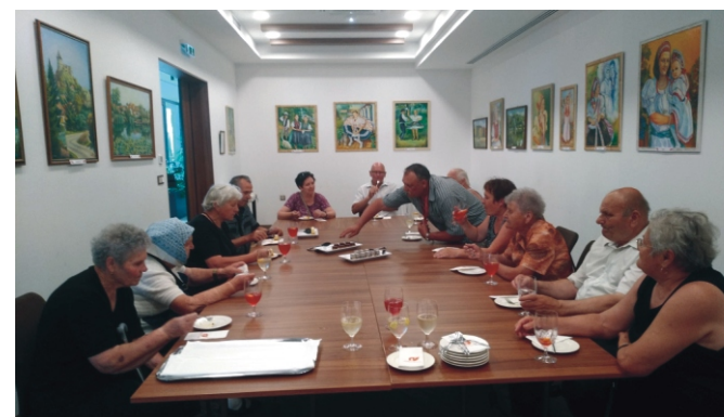
Vendégvárás a Castellum Hotel Hollókő különtermében