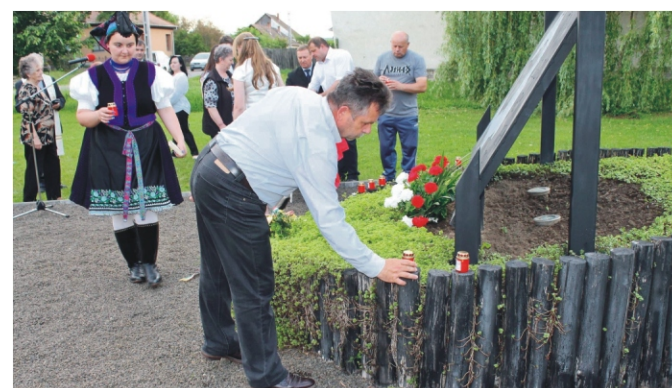
Mécseseket is elhelyeztünk az emlékműnél