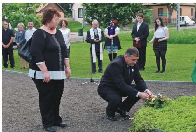
Rimóc Község Önkormányzata és a Rimóci Szent István Általános Iskola képviselői koszorút helyeztek el