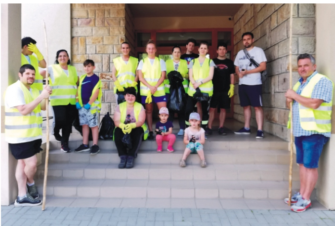
A szemétszedők indulásra készen