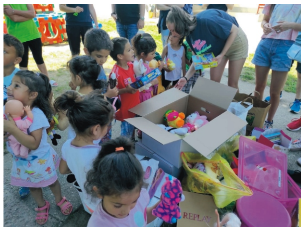
Az ajándékosztás örömteli pillanatai