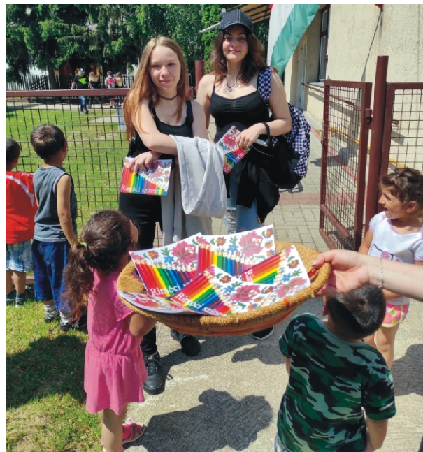
Köszönatképpen a Rimóci Színező