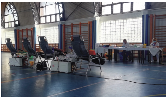
Egyre kevesebb a véradó

VÉRADÁS 2021.06.13. (vasárnap) Véradók száma: 29 fő ebből: kiszűrt: 2 fő új véradó: nem volt.