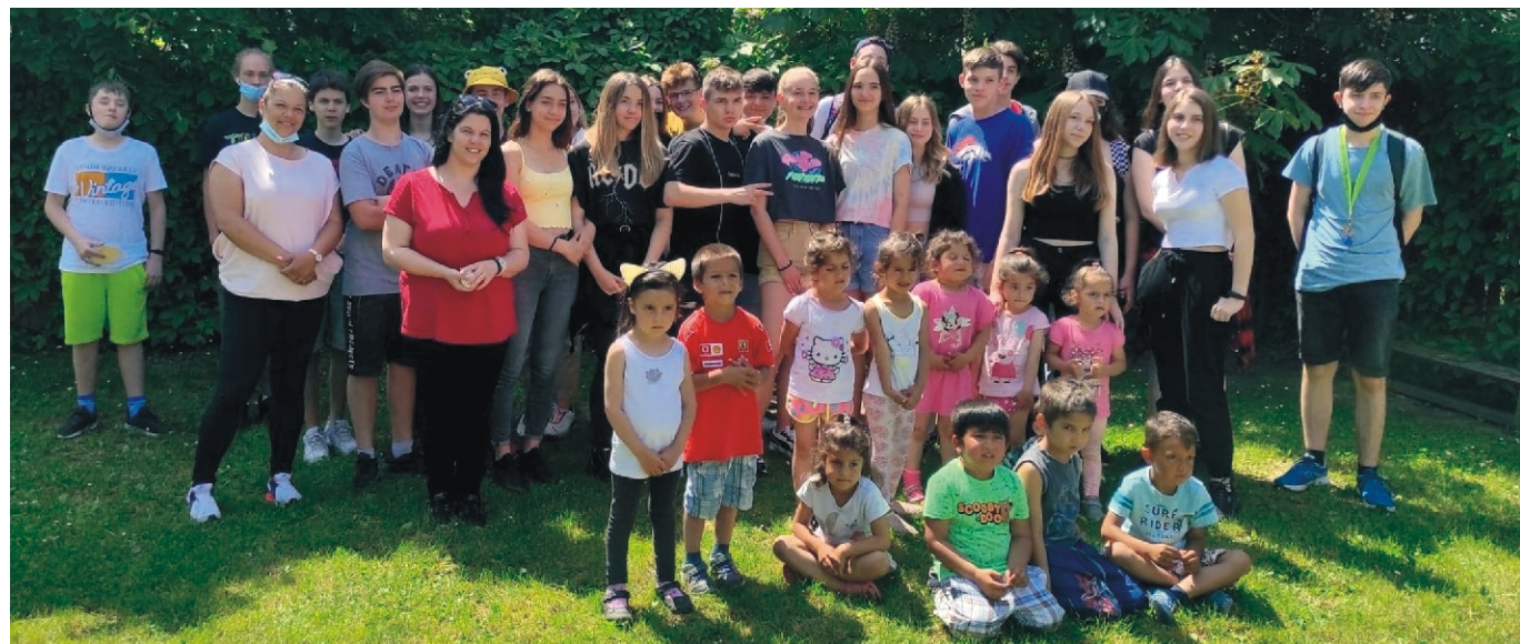
Az együtt töltött délelőtt emlékére