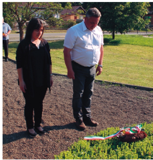
A polgármester úr és az alpolgármester asszony koszorúzás közben