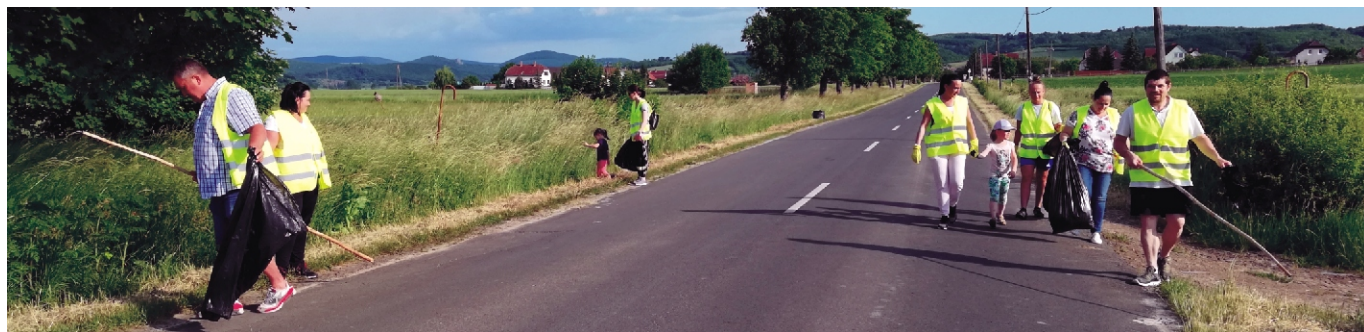
Most a belterület szemetesebb volt, mint a külterület