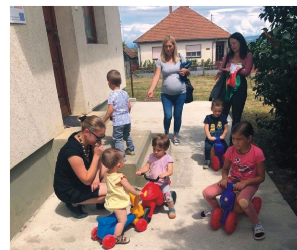
Nyári élmények a gyerekházban