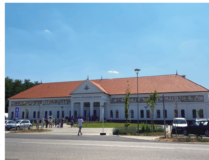
Nemzeti Művelődési Intézet székháza