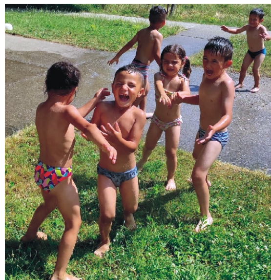
Frissítő vizsugár jól esik a nagy melegben