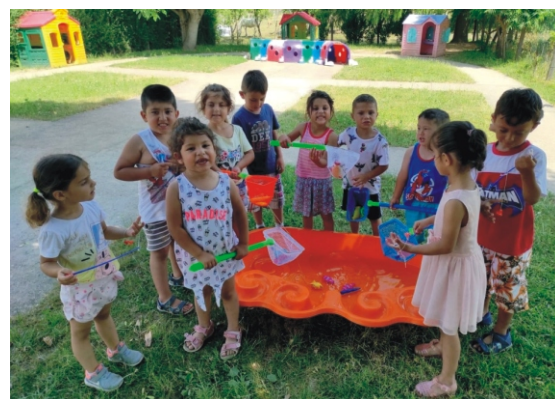
Ilyenkor előkerülnek a vizes játékok is