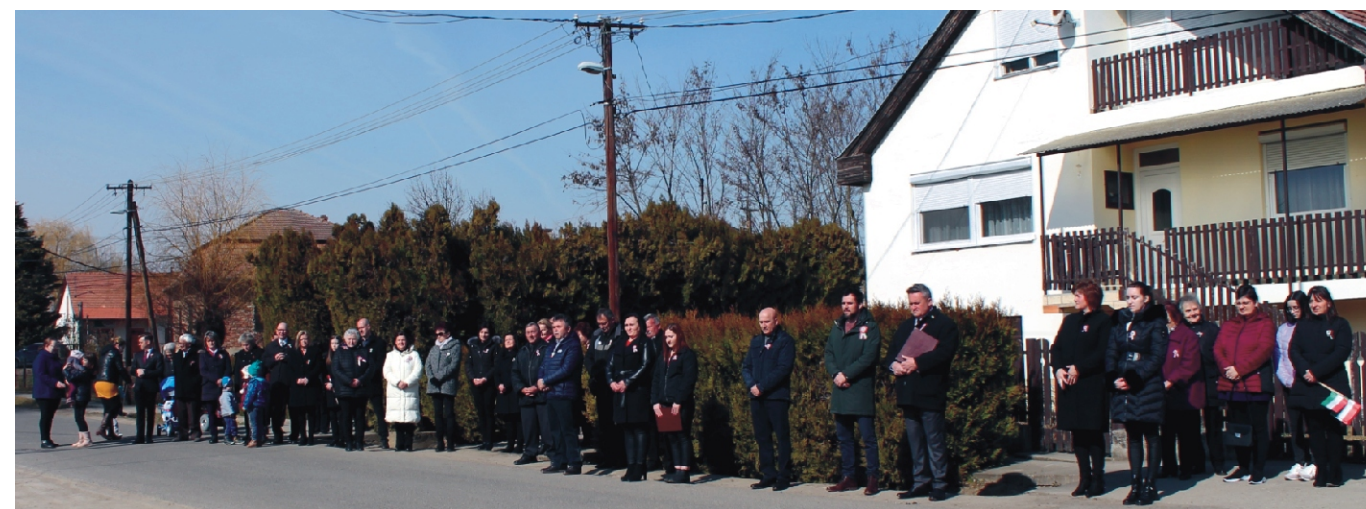
A megemlékezésen résztvevők