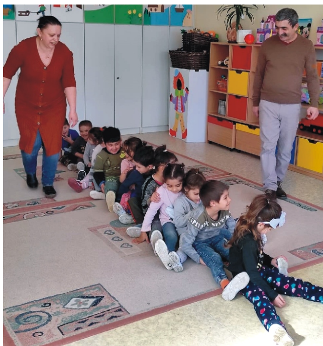
„Sülnek a kenyerek” - az egyik kedvenc játék