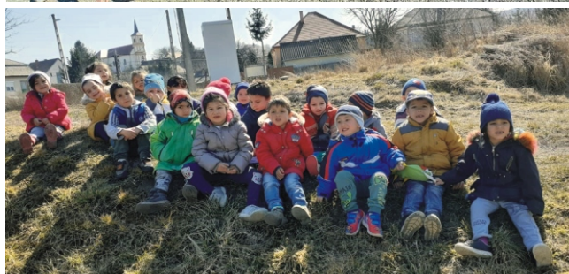
Nem kell messzire menni egy jó kiránduláshoz

A Húsvét a Feltámadás. A megújulás Ünnepe! Ne csak külsőben, de belsőleg is meg kell újulnunk, Olyan sok rossz dolog vesz körül minket, haláleset, betegség, háború, egyet nem értés... Már sokszor a kis közösségekben, falun belül a családban sincs meg az az egység, ami szükséges ahhoz, hogy ez az ország, Mária országa fennmaradjon. Sokszor keressük a hibát, a hibást, de nem tűnik fel, hogy elsősorban saját magunkba kell keresni azt. Ne másokat, magunkat akarjuk jobbá tenni és akkor lehet, lesz jövője a magyar családoknak, a falvaknak, városoknak a Nemzetnek. Sokan felismerték és ma is sokan felismerik, hogy a Szűzanya oltalmára nagy szüksége van az egész világnak. Szükség van az emberi küzdésre, de be kell látni, hogy hit nélkül, széthúzással semmire sem megyünk.