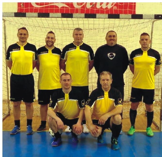
Rimóc senior csapata