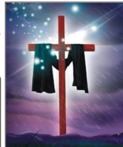
Áldott, békés húsvéti ünnepeket kíván a Rimóci Újság szerkesztősége!

Aztán gondol egyet, fülig fut a szája, s ránevet a fényben hunyorogó világra.