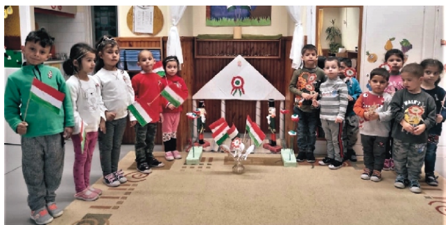
„Éljen a magyar szabadság! Éljen a hazai!”