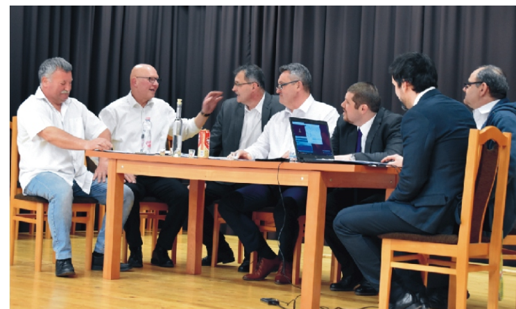
A nőnapra vidám műsor