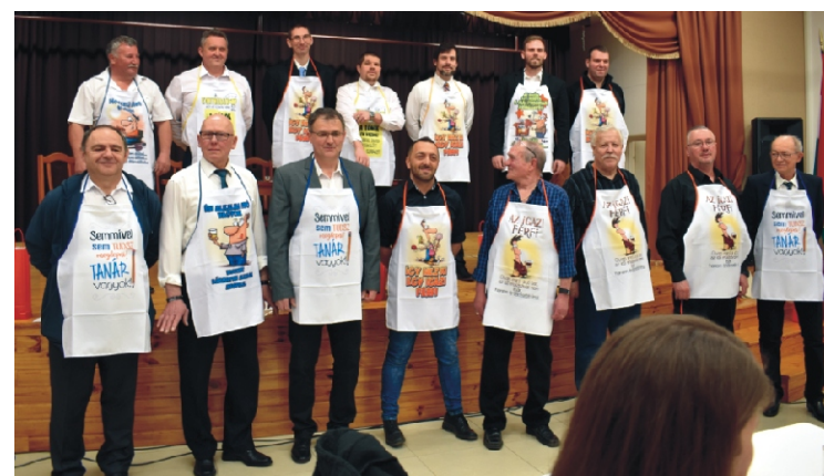
A férfiak felöltötték a hölgyektől kapott ajándékot