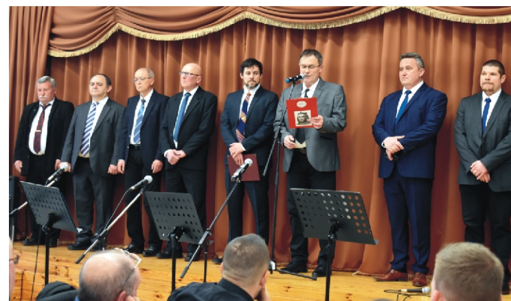
A férfiak komoly műsor közben