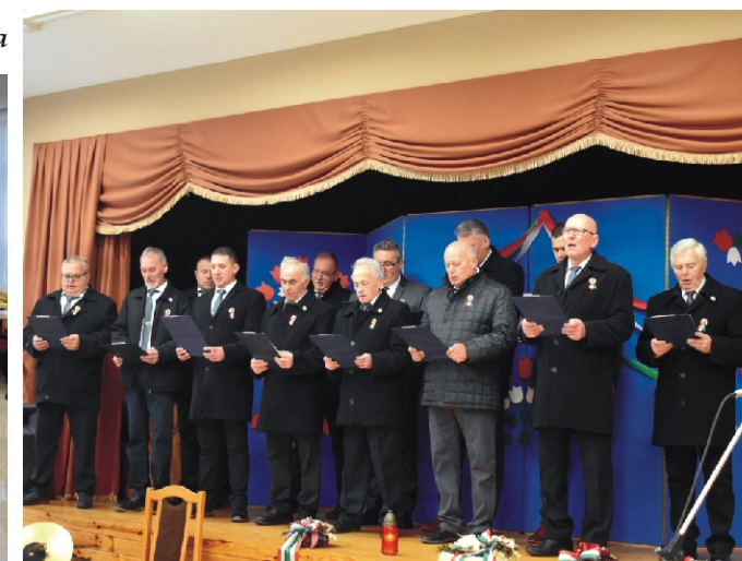
Szent József Katolikus Férfiszövetség