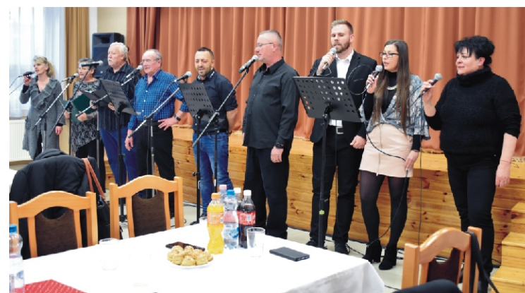
A nagylóci Ebenguba Ikka Band előadás közben