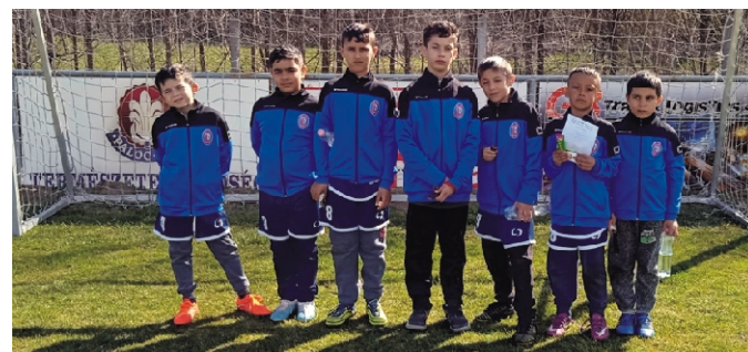
Megkezdődött az U7-es és az U9-es Bozsik bajnokság