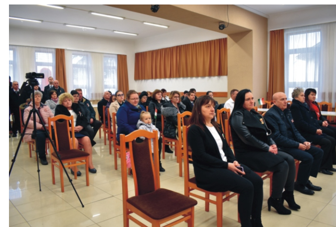
Az ünnepségen résztvevők