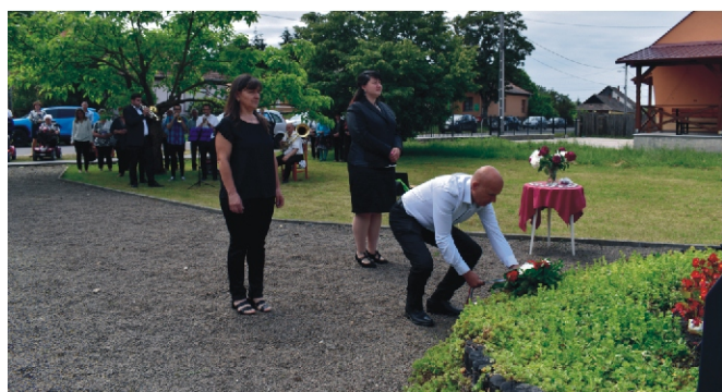
Rimóc Község Önkormányzatának Képviselő-testülete