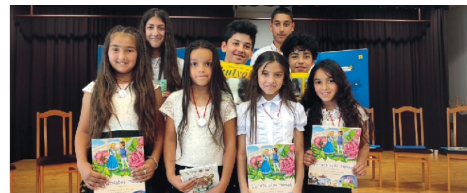
Az iskola kitüntettjei