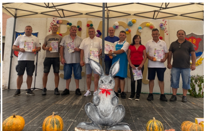
Pálinka- és borverseny résztvevői