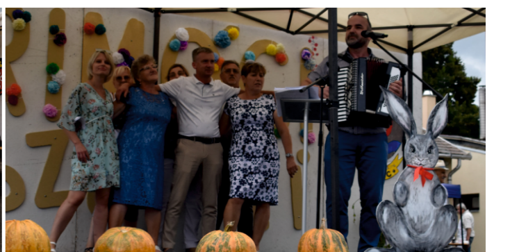
Lengyel vendégeink fellépés közben