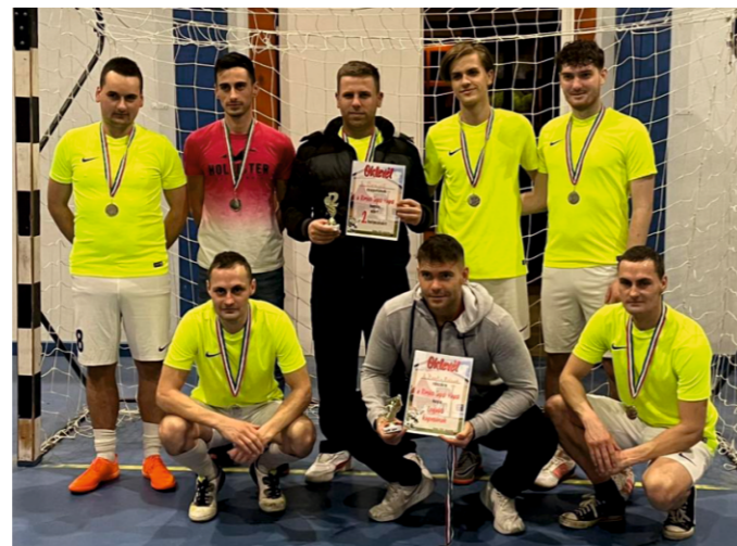
Duracell 2. helyezett