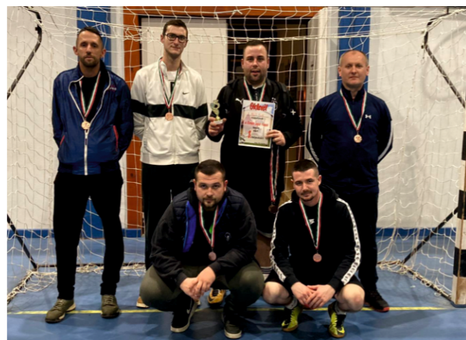
Nyúl York 3. helyezett