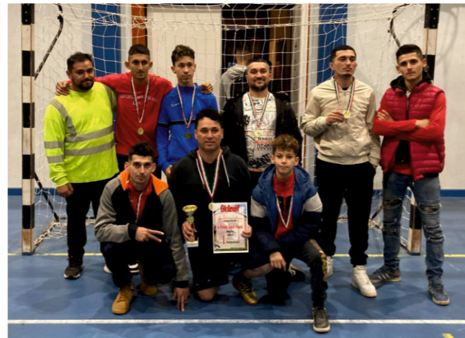
Brazilok 1. helyezett